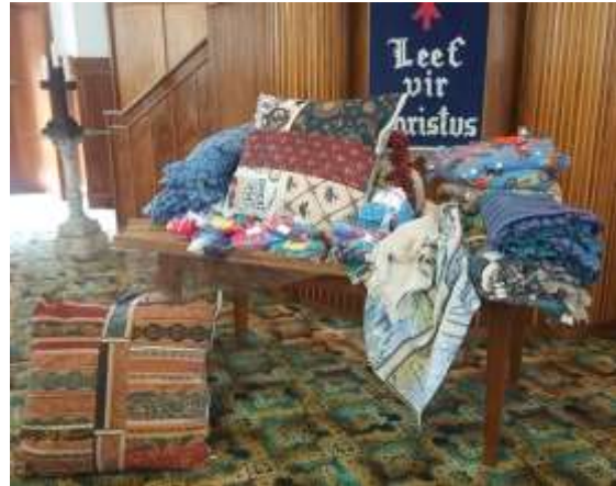
Foto links: Die komberse is by CTK afgelewer en die gesiggies spreek van dankbaarheid. Dankie aan almal wat gehelp het om hul hartjies bly te maak.