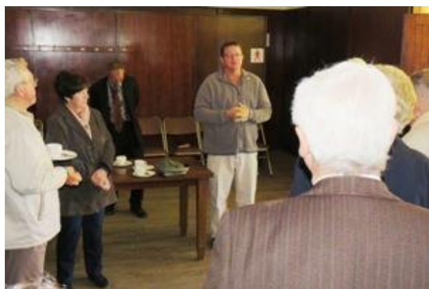
Polisiëringsforum-besoek - September

Die Posduif-redaksie wens al ons medewerkers en lesers 'n baie Geseënde Kersfees en voorspoedige 2019 toe. Baie dankie aan al ons medewerkers en lesers en ons maak staat op jul verdere ondersteuning in die nuwe jaar.