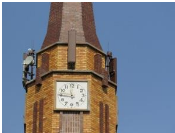
Kerktoring genereer inkomste!!