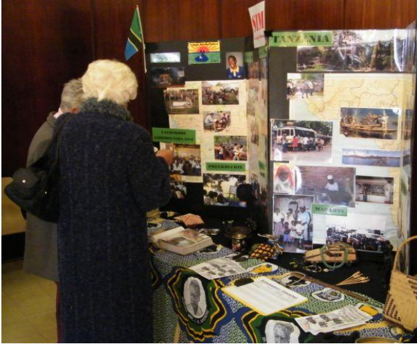
Uitstalling na afloop van die diens.