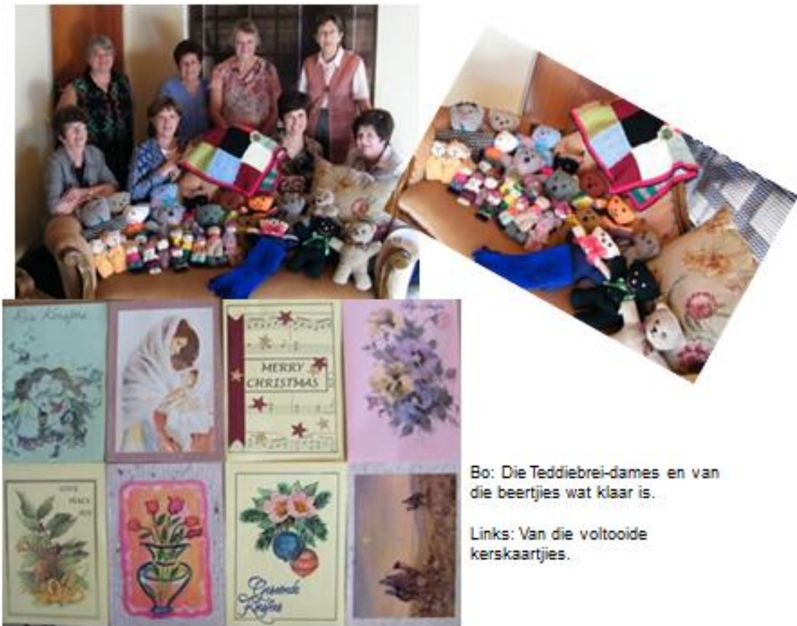
Bo: Die Teddiebrei-dames en van die beertjies wat klaar is.